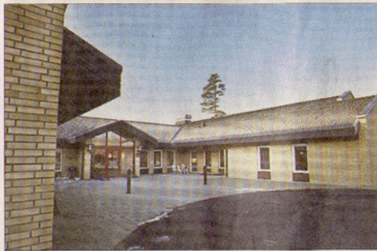
En tall vakar även över det nya Solängen.