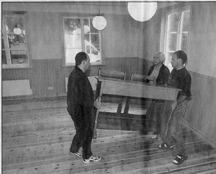
Bänkar på rad. Just nu möbleras "Den gamla salen" i Skolmuseet. Invigningen sker den 10 september men hela Skolmuseet invigs först någon gång under nästa år.